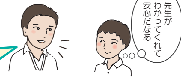
2人きりの安心できる環境で